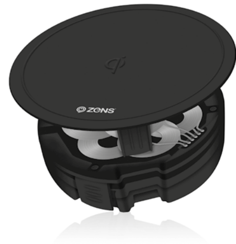
ZENS PuK ZESCO2N/00